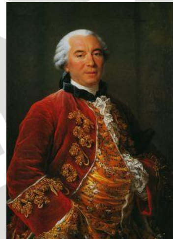
Comte de Buffon

Muchos creían en la unidad de la especie humana, pero algunos pensaban que Dios había creado especies humanas diferentes. En este modelo, los blancos europeos fueron descritos como más cercanos a los ángeles, mientras que a los africanos negros y a los aborígenes se les consideraba más cercanos a los simios.